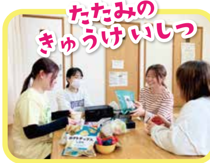
たたみのきゅうけいしつ

西宮の就職フェア 西宮保育士就職支援事業【ここにし*】 ※ここにしのウェブサイトは小規模・中規模などで絞り込みができる。 通勤を考慮しGoogl Mapでエリアを決めた